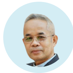
ศ.จ.ดร.สมเกียรติ วรรณศรี ศิษยาภิบาล