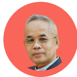
ศ.จ.ดร.สมเกียรติ วรรณศรี ศิษยาภิบาล