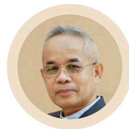
ศจ.ดร.สมเกียรติ วรรณศรี ศิษยาภิบาล