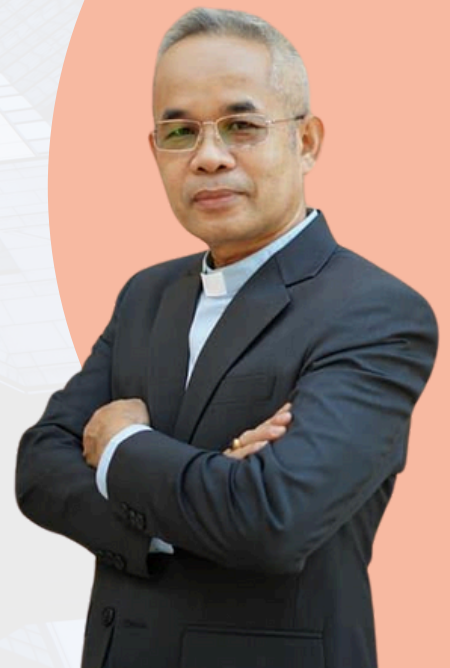
ศิษยาภิบาล ศจ.ดร.สมเกียรติ วรรณศรี