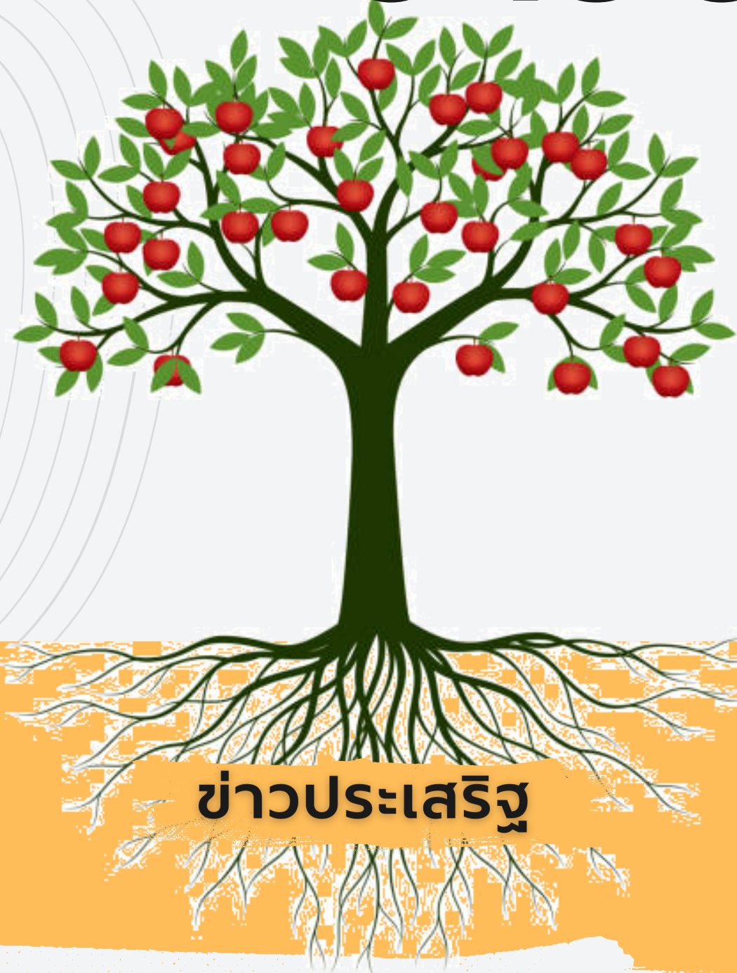
ข่าวประเสริฐ