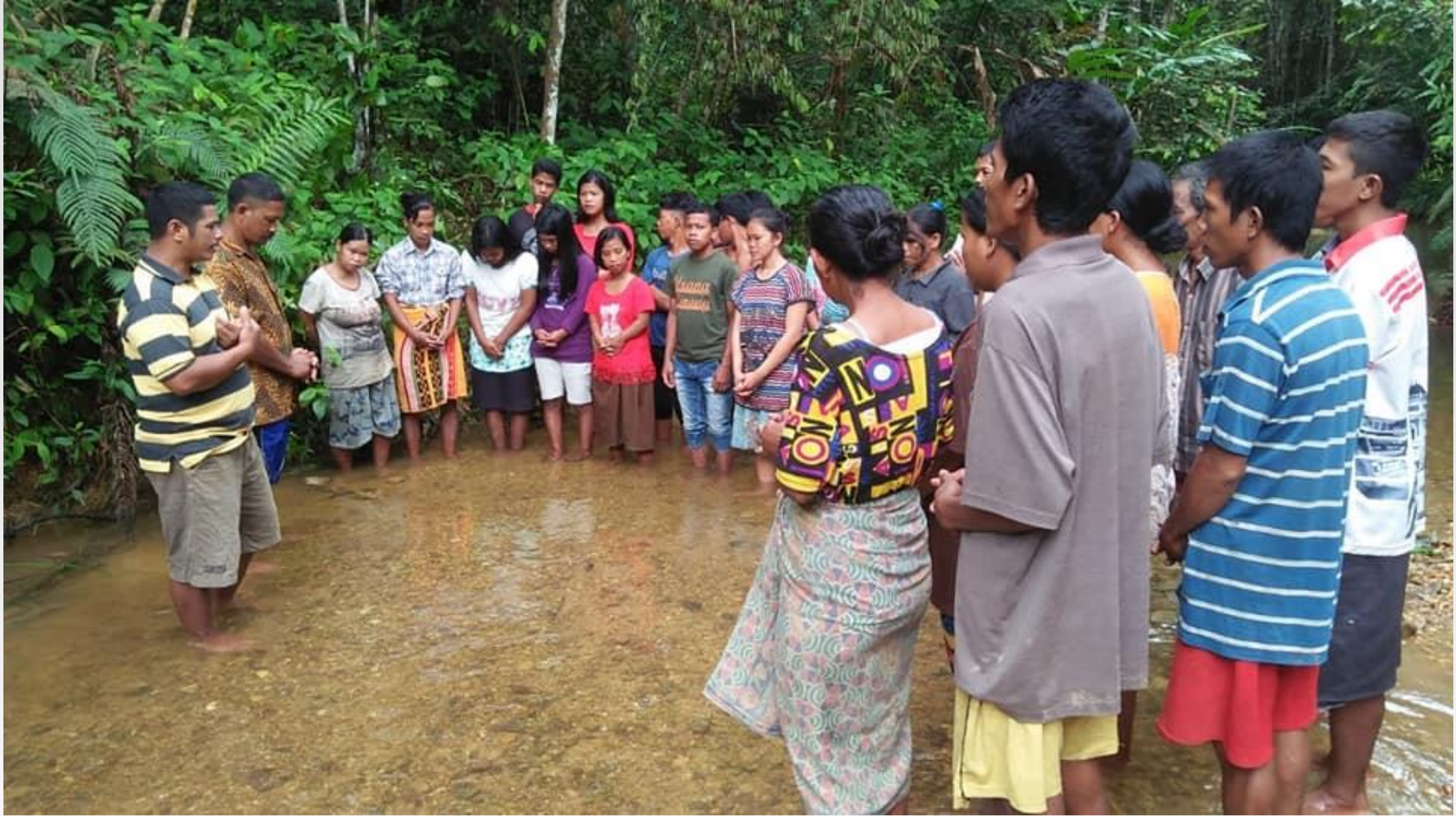
Jungle baptism in April 2020 (29 people on this occasion)