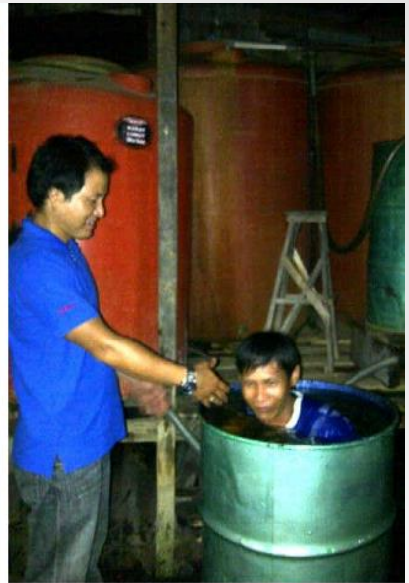
Private baptisms in sensitive areas